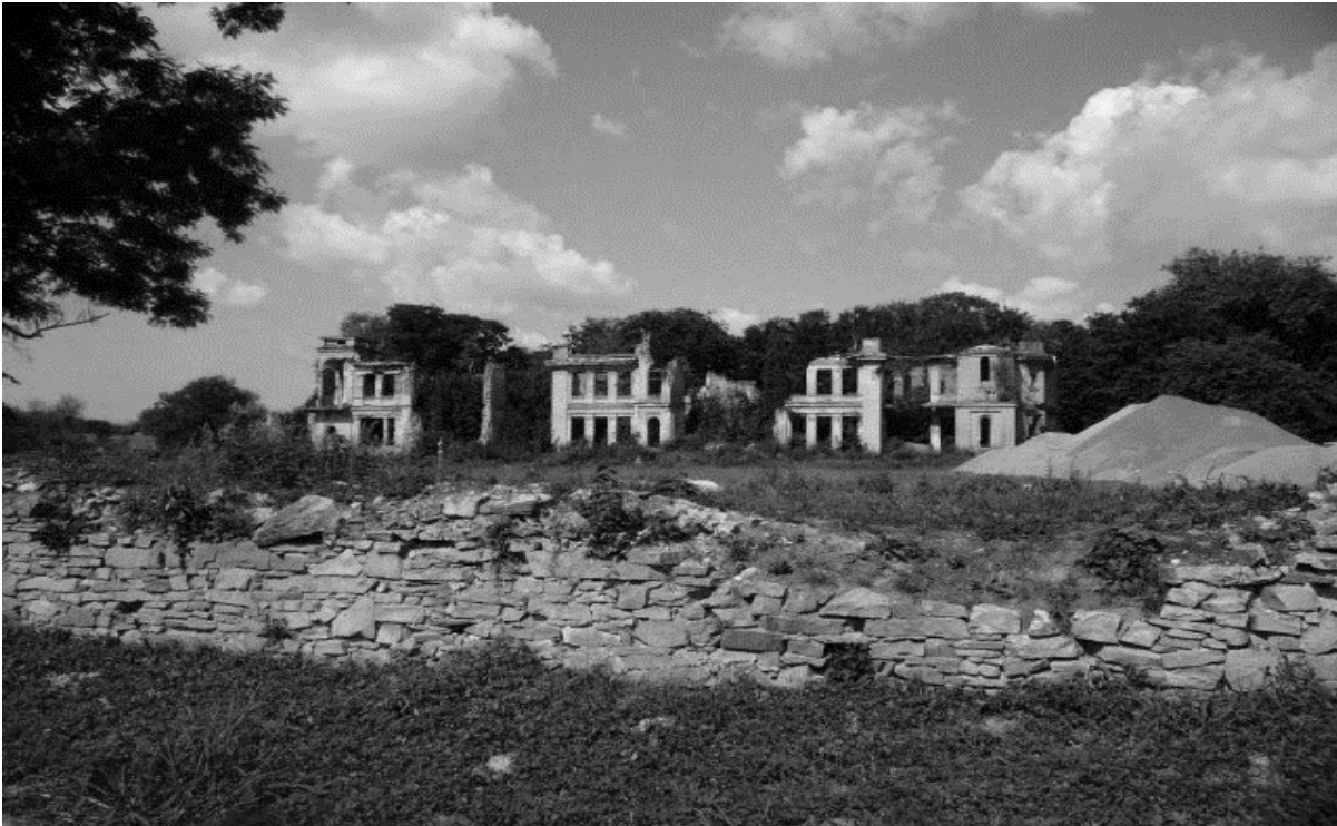
Pałac we Włostowie widok obecny