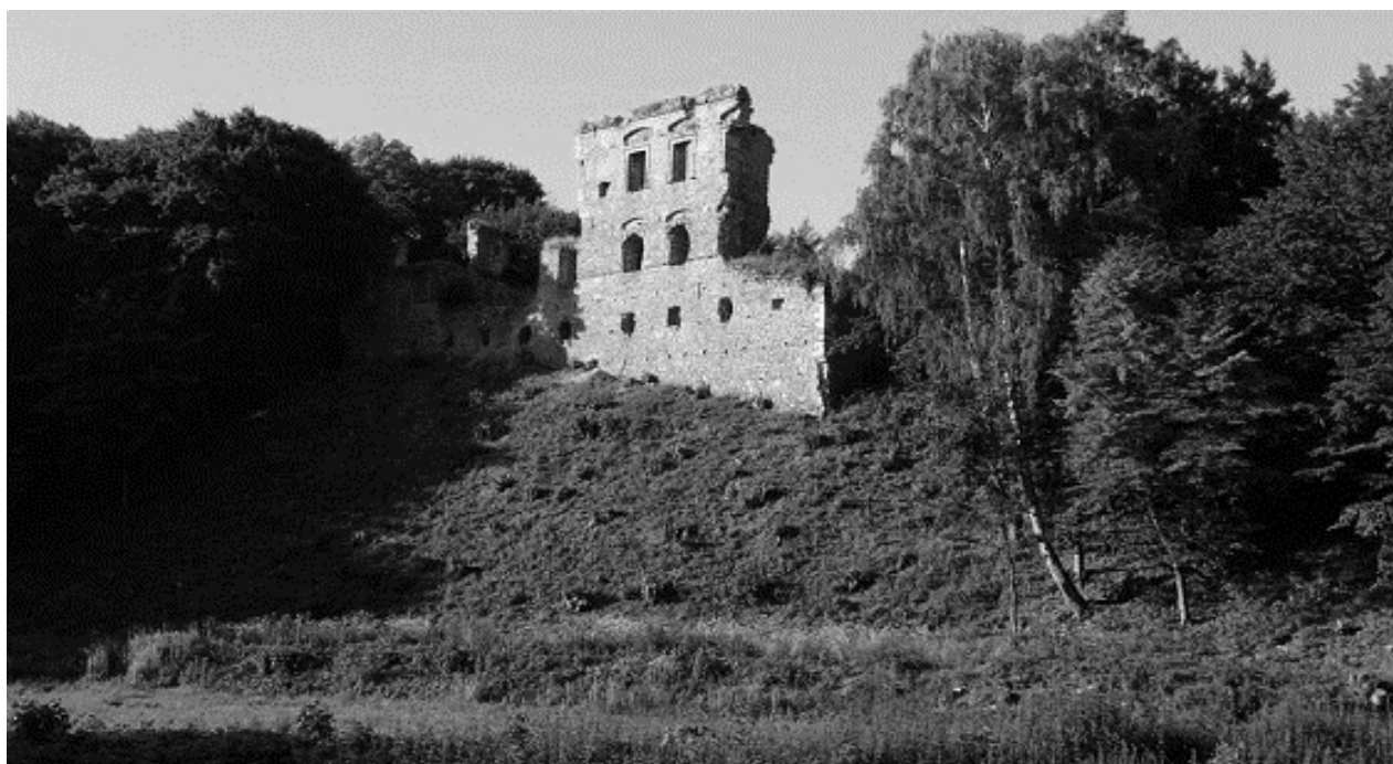
Ruiny zamku w Międzygórzu