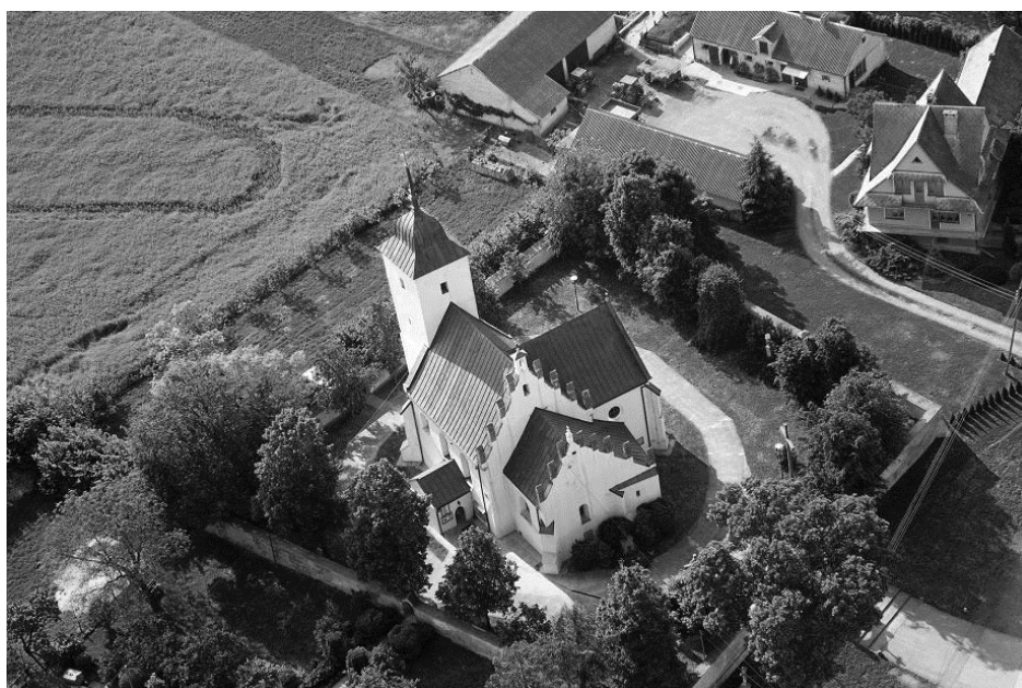
Kościół parafialny we Włostowie z lotu ptaka