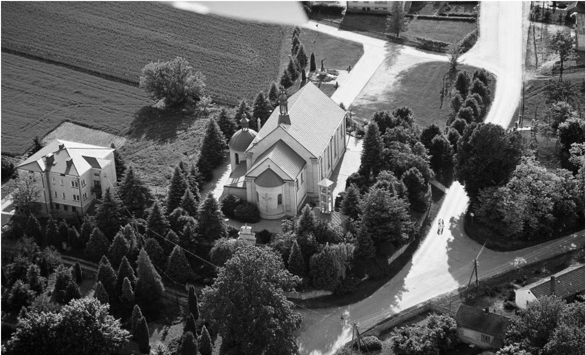
Kościół w Malicach Kościelnych w lotu ptaka

Jedna z najstarszych wsi sandomierskich położona w dolinie Opatówki.