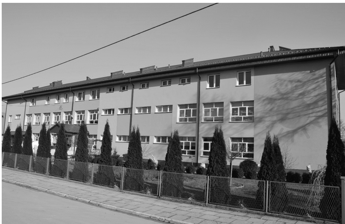
Zespół Szkolno- Przedszkolny w Lipniku