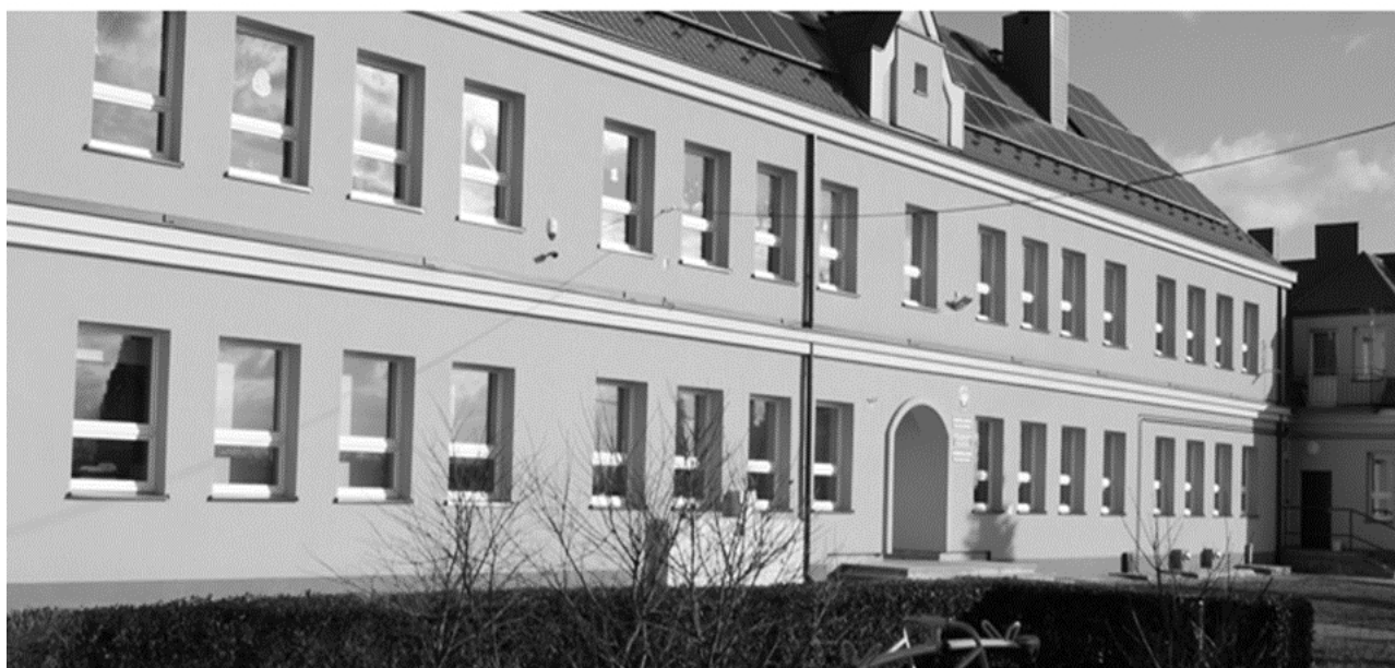
Szkola Podstawowa we Włostowie

Położona 6 km od Opatowa, przy ważnej i ruchliwej szosie Warszawa - Rzeszów wieś Włostów jest jedną z największych w pow. opatowskim. Zajmuje powierzchnię 907,8 ha. Włostów ma charakter większej osady o rozbudowanym, nieregularnym układzie ulic.