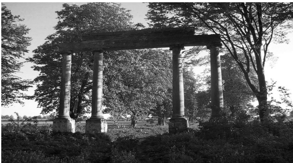
Brama wjazdowa do parku

Otoczający pałac park (wraz z innymi obiektami zabytkowymi w tym kompleksie przyrodniczo - kulturowym Włostowa) podnosi atrakcyjność krajoznawczą tej miejscowości. Dlatego powinien być bardziej chroniony przez mieszkańców. Obecne założenie parkowe (ok. 10 ha), utrzymane w duchu romantycznym o kierunku krajobrazowym, pochodzi z połowy XIX w., a więc z okresu budowy nowej siedziby włostowskich panów. Zapewne park w tym miejscu istniał wcześniej, czyli już w XVIII w.