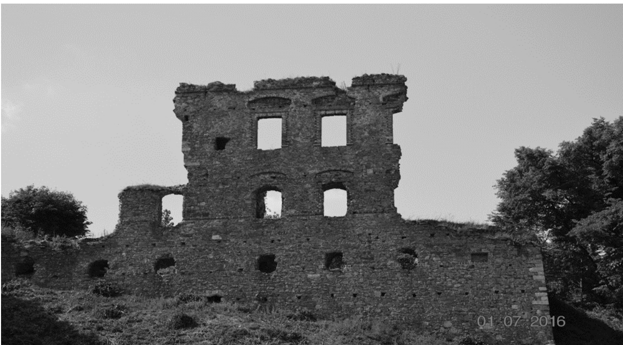
Ruiny zamku w Międzygórzu

Najciekawszym i najbardziej tajemniczym zabytkiem doliny Opatówki są romantyczne ruiny zamku w Międzygórzu.