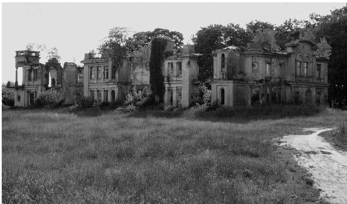
Pałac we Włostowie widok obecny

Okazały pałac rodziny Karskich uchodził w międzywojennej Polsce za najnowocześniejszą i najlepiej utrzymaną rezydencję ziemiańską w Sandomierskiem. W porównaniu z innymi zamkami i pałacami był obiektem stosunkowo młodym, technicznie dobrze zbudowanym i wyposażonym w media techniczne.