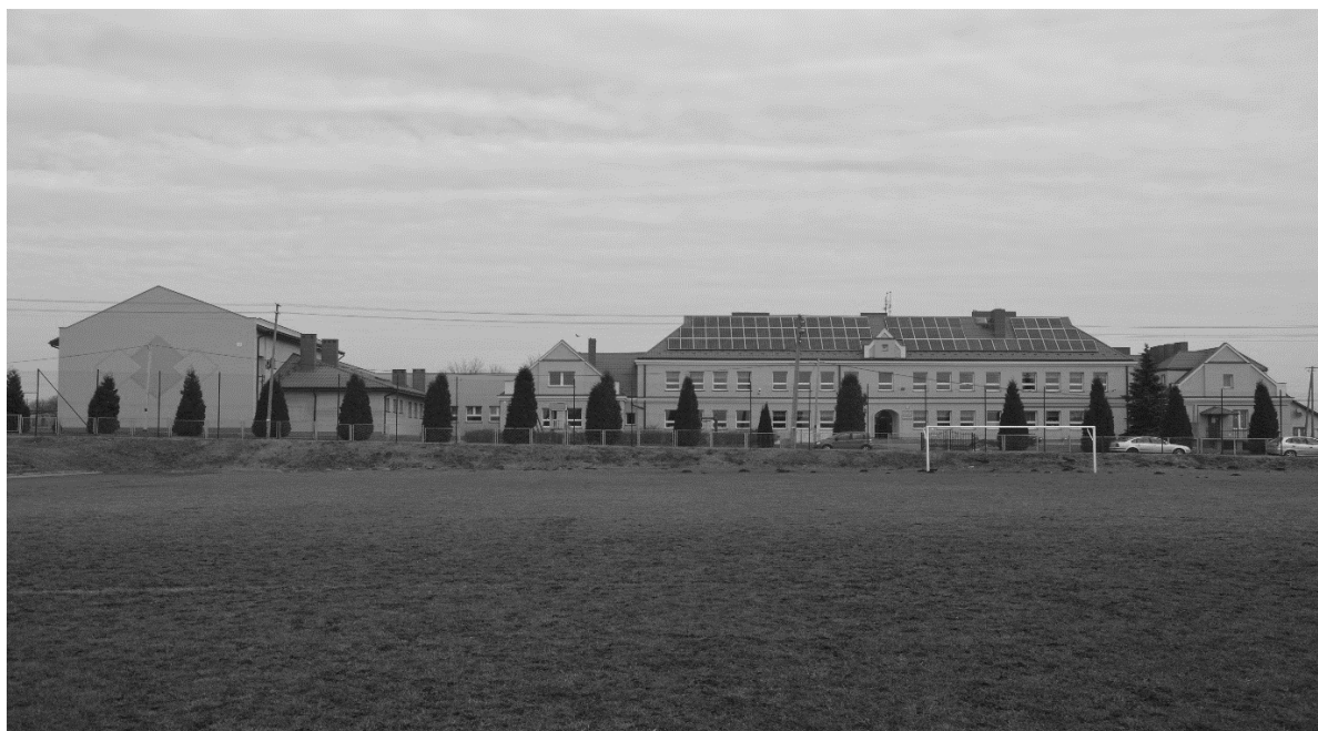
Widok na Szkołę Podstawową we Włostowie od strony boiska sportowego

W średniowieczu leżał przy uczęszczanym trakcie opatowskim i szlaku handlowym do Kijowa i innych wschodnich grodów. Już wtedy był rozległą wsią z polem targowym tzw. targowiskiem. Przez pewien czas konkurował z Opatowem, ale już od XV w. pozostał w tyle i nigdy już nie osiągnął większego znaczenia jako lokalny ośrodek handlowy.