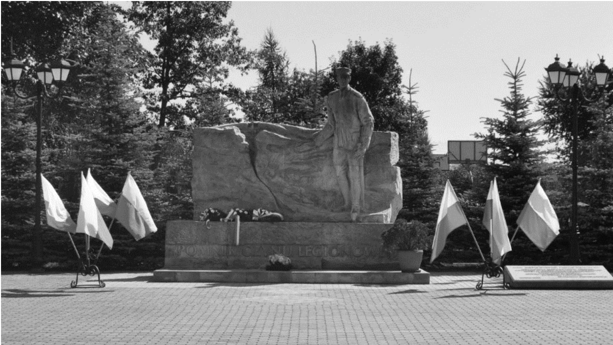
Pomnik „Czynu Legionowego” w Lipniku